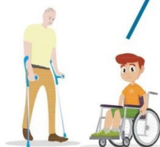
Люди с ограниченными возможностями здоровья